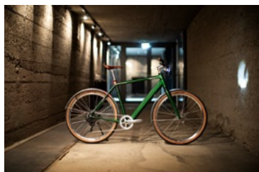
Merano XV DMT Earl Green

Das Besondere der XV-Edition liegt in den exklusiven Details. Zum Geburtstag spendiert Coboc edle Silber-Komponenten, die perfekt mit den handgenähten, braunen Velo-Ledergriffen und dem passenden Sattel harmonieren. Von den schlanken Curana-Schutzblechen über den Coboc URBAN Lenker bis hin zur exklusiven „15 years“-Klingel von Cobell brilliert die Limited Edition an jeder Ecke. Selbst die ikonische Supernova Mini 2 Frontleuchte strahlt am Vorbau in glänzendem Silber. Egal ob tägliches Pendeln, die Shopping-Tour oder die ausgedehnte Landpartie: Mit gerade einmal 15,6 kg Gewicht fliegt das Merano XV förmlich dahin, ganz gleich, ob mit oder ohne elektrische Unterstützung. Der unsichtbare Heckantrieb schiebt mit bis zu 500 Watt Spitzenleistung so natürlich an, als hätte man permanent Rückenwind. Das System, der Coboc Electric Drive, ist eine hauseigene Entwicklung und lässt sich via App individuell auf das eigene Fahrverhalten konfigurieren. Last but not least sorgt die breite WTB-Bereifung für zusätzlichen Komfort, indem Schotterwege oder Unebenheiten geschmeidig glattgebügelt werden. So verbindet das Coboc Merano XV puren Lifestyle mit echtem Nutzwert. Erhältlich ist das Sammlerstück zum UVP von 4.799 Euro ausschließlich im Coboc-Fachhandel.