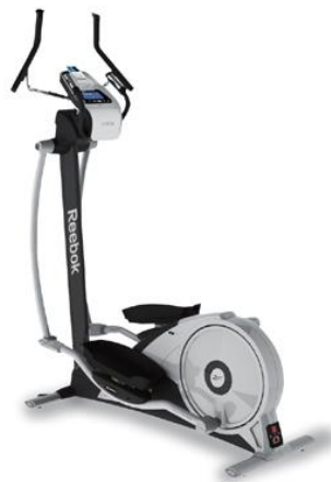
Reebok CCT 6.8e

Doppellautsprecher. Man kann seine eigene Musik in hervorragendem Klang direkt von der Playlist des iPod hören, der gleichzeitig auch wieder aufgeladen wird. Mit 17 verschiedenen Programmen (fünf davon individuell), einem Speicher für bis zu neun Personen, integriertem POLAR-Pulseempfänger sowie Handpulssensoren ist der neue Reebok CCT ein äußerst effektiver Crosstrainer, der Ganzkörpertraining in absoluter Vollendung bietet.